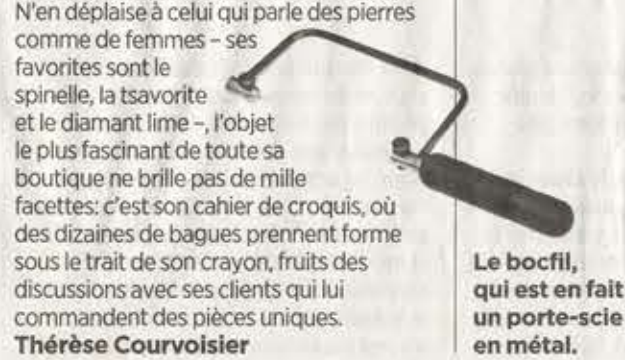
Le boccil, qui est en fait un porte-scie en métal.