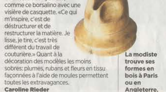
Un chapeau créé avec des broderies indiennes.

le moule. Complexe, l'opération peut prendre plusieurs heures, comme pour ce modèle en accordéon. Les formes, elle les dénêche à Paris ou en Angleterre, car le métier de formier aussi se perd. Les structures de bois contribuent à faire naître capelines, hauts-de-forme ou encore des hybrides, comme ce borsalino avec une visière de casquette. «Ce qui m'inspire, c'est de déstructurer et de restructurer la matière. Je lisse, je tire, c'est très différent du travail de couturière.» Quant à la décoration des modèles les moins sobres: plumes, rubans et fleurs en tissu, façonnées à l'aide de moules permettent toutes les extravagances. Caroline Rieder