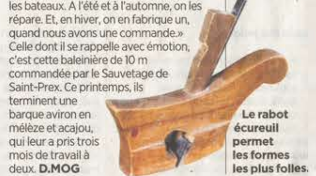
Le robot écreuil permet les formes les plus folles.

sans doute aussi faire du plastique pour s'en sortir. Parce qu'on peine à facturer le prix réel: pendant qu'on pose un seul bordage, nos collègues réalisent toute une coque en polyester.» Avec son apprenti (son dixième) et parfois un stagiaire, l'artisan suit le rythme des saisons. «Au printemps, on prépare les bateaux. A l'été et à l'automne, on les répare. Et, en hiver, on en fabrique un, quand nous avons une commande.» Celle dont il se rappelle avec émotion, c'est cette baleinière de 10 m commandée par le Sauvétage de Saint-Prex. Ce printemps, ils terminent une barque aviron en mélèze et acajou, qui leur a pris trois mois de travail à deux. D.MOG